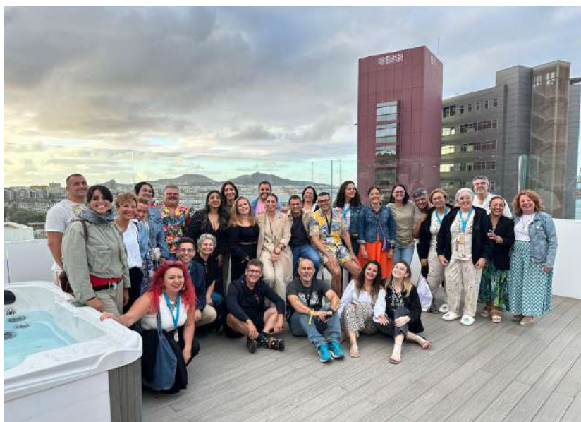
15 CIUDADES UN SOLO OBJETIVO

Nos íbamos a encontrar en un mismo espacio, técnicos y técnicas con realidades, inquietudes, dificultades, preguntas y respuestas probablemente muy distintas. Este hecho lo entendíamos, no como un inconveniente, sino como una ventaja que vendría a enriquecer nuestro trabajo.